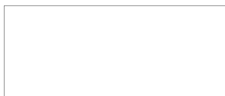
Nome do Representante Legal CPF nº XXX.XXX.XXX-XX Representante Legal da XXXXXXXX